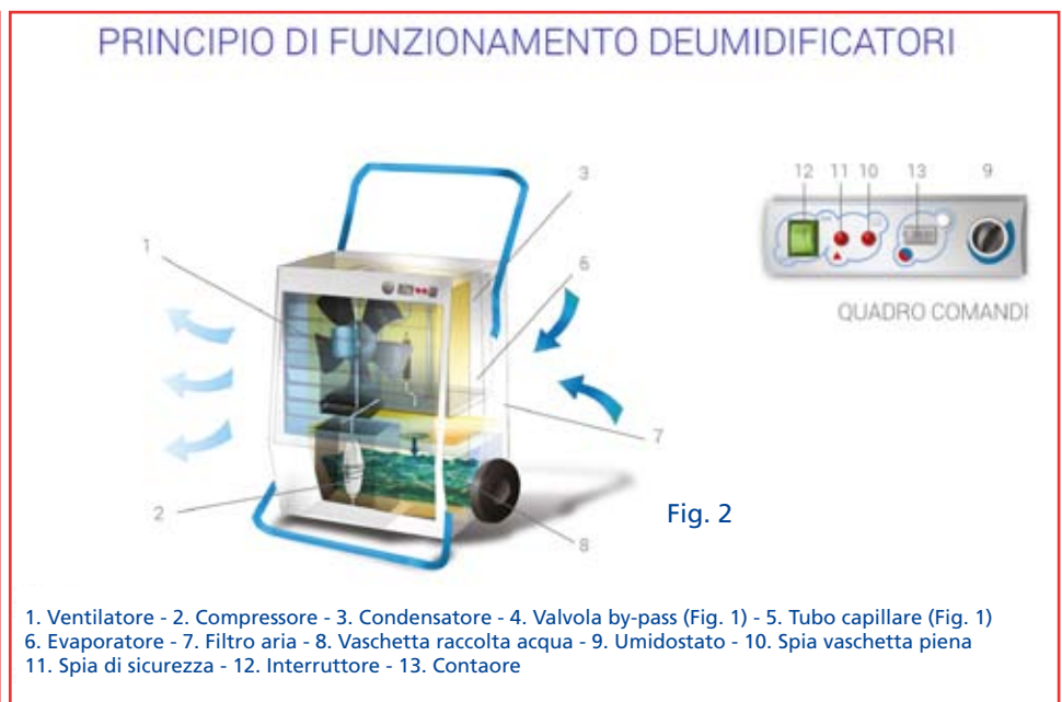
1. Ventilatore - 2. Compressore - 3. Condensatore - 4. Valvola by-pass (Fig. 1) - 5. Tubo capillare (Fig. 1) - 6. Evaporatore - 7. Filtro aria - 8. Vaschetta raccolta acqua - 9. Umidostato - 10. Spia vaschetta piena - 11. Spia di sicurezza - 12. Interruttore - 13. Contatore

Riel S.r.l. si riserva il diritto di apportare, senza obbligo di preavviso, modifiche tecniche, estetiche e dimensionali ai prodotti presentati.